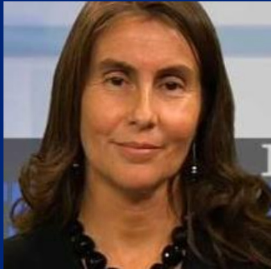
XIMENA CLARK , EX DIRECTORA, INSTITUTO NACIONAL DE ESTADÍSTICAS (INE), CHILE