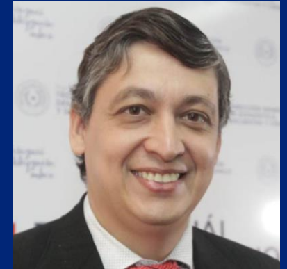
IVÁN OJEDA , DIRECTOR, DIRECCIÓN GENERAL DE ESTADÍSTICA, ENCUESTAS Y CENSOS (DGEEC), PARAGUAY